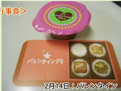
2月14日：バレンタイン