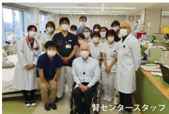
腎センタースタッフ

一方、慢性腎臓病(CKD)が進行し末期腎不全になると、自身の腎臓の替わりをする治療(腎代替療法といいます)が必要となります。腎代替療法には透析療法と腎移植があります。透析療法は、人工的に腎臓の働きを代行し、血液をきれいにする治療法です。透析には血液透析と腹膜透析の2つの方法があり、当院の腎センターでは約50年前からこれらの治療を行っています。日本の透析医療は世界でも最高水準であり、県内には40年以上も治療を続けている方がいらっしゃいます。また、腎移植は、以前と比べ成績も格段に向上し、より一般的な治療となっています。当院の腎センターは、腎代替療法が必要となった患者さんに対し、上記の治療法をわかりやすく説明したうえで、個人の生活に最も適した治療法をともに考え実践していく、良き伴走者でありたいと考えています。