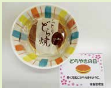
4月4日：どらやきの日